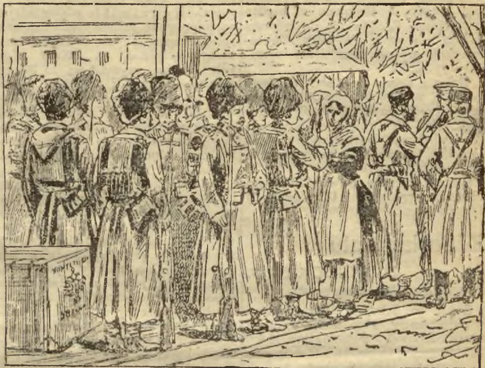
Rosyjscy rezerwiści czekający na pociąg, który ma ich zawieźć na plac boju

tych pod odzieżą szczydłach poruszał się, dosięgając niebotycznym cylindrem wyżyny drugiego piętra kamienic; był król klubowy, którego płaszcz, pseudo-grunostajami bramowany, wlokł się na 50 metrów za nim, niesiony przez dwudziestu czterech dygnitarzy; było mnóstwo innych kawałów, przyjmowanych przez tłumy publiczności wrzawą, radością i hucznymi salwami oklasków.