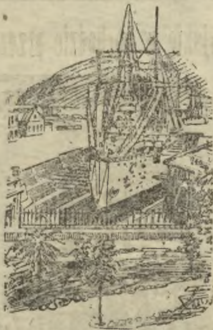
Suchydok w Porcie Artura.

pođisało konwencyę hagską. Japonia protestuje przeciw temu sposobowi obrony jej honoru, aby sąd zajmował się kwestyą mu nie przydzieloną. Japonia protestuje przeciw ubliżającym uwagom Murawiewa i żąda przyjęcia protestu do protokołu obrad sądu rozjemczego, oraz ogłoszenia uwag, jakie spowodowały wniesienie protestu