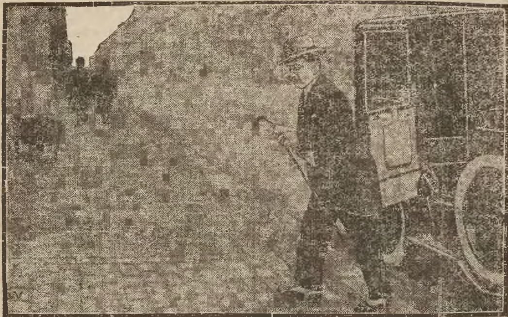
Posel francuski w Berlinie, de Margerie, udaje się na konferencję francusko-niemiecką do ministra niemieckiego dra Stresemana w Ministerstwie spraw zagranicznych w Berlinie.