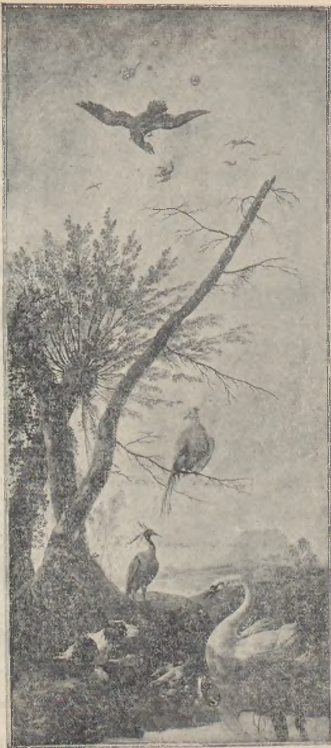
Jan Pillent: Chinoiserie (3)