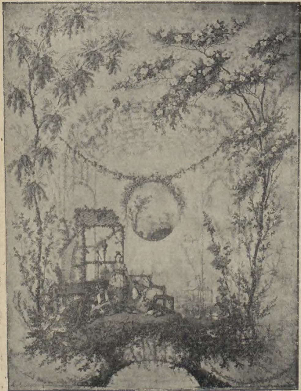
Jan Pillement: Chinoiserie (I)