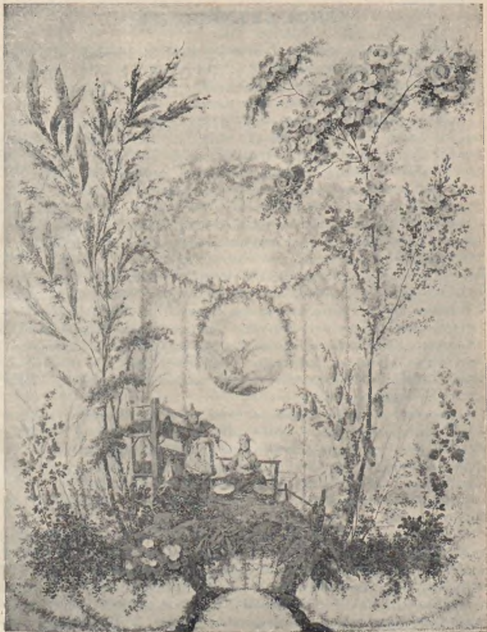
Jan Pillement: Chinoiserie (4)