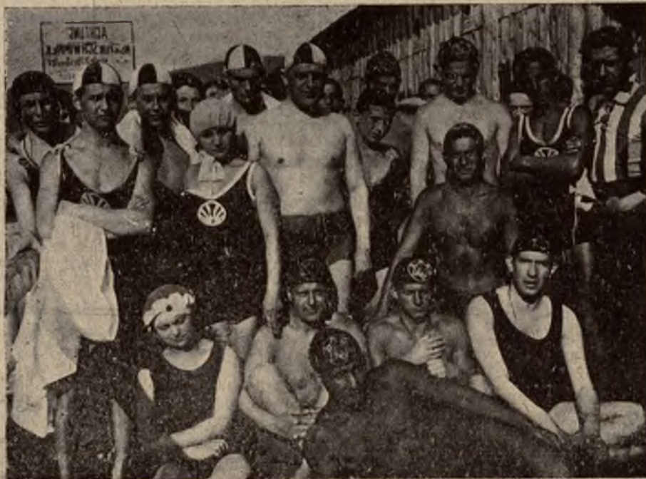
Drużyny piłki wodnej Hakoah (Bielsko), Jutrzenka (Kraków).