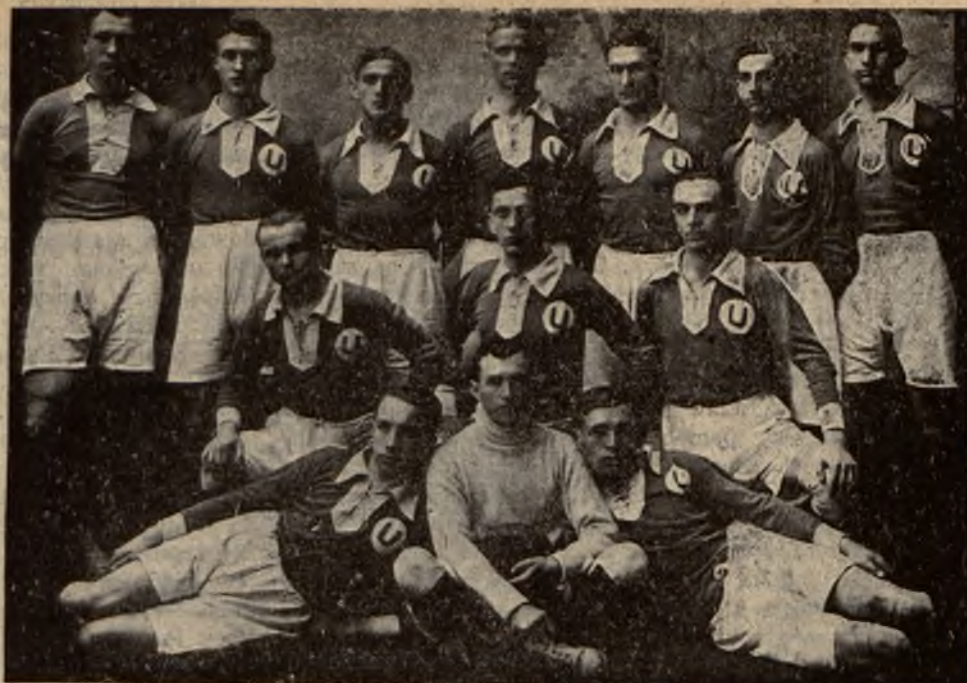
Drużyna T. S. „Union“ w Łodzi.

18. 8. Hakoah—Kaniów 1:0 (1:0). Na ośligłem po deszczu boisku D. O. K. rewanżowe zawody, tymrazem zakończone zwycięstwem Hakoahu. Zwycięską bramkę strzelił Segal po rzucie z rogu. Gracz ten tem uświetnił swój jubileusz, gdyż grał poraz 50-ty w barwach swego klubu. Gra do paazy dość ostra, lecz fair. Nie widać czyjejkolwiek przewagi. Jedynie Kaniów stwarza więcej niebezpiecznych sytuacji pod bramką Hak., lecz ani razu niewyzyskanych. W II. poł. gra ospała, chaotyczna. Jeśli chodzi o charakterystykę obu klubów, to Hakoah posiada dobre tyły (obrońca Rosenblatt) i ładnie kombinujący atak, lecz zato pomoc słaba (prócz lewego pomocnika), zanadto trzyma się defenzywy. Kaniów posiada zupełnie słabe tyły, bramkarz niepewny, tosamo obrona; atak kombinuje na miejscu i brak mu ciągu na bramkę i strzałów, pomoc niezła. Sędzia, p. Fiedler, zadowolnił.