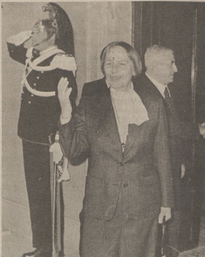
RZYM. — Przewodnicząca Izby Delegatów Komunistycznych Nilde Jotti, spotkała się w pałacu Quadraline z prezydentem Sandro Pertini. Rozmawiano na temat ostatniego kryzysu rządowego.