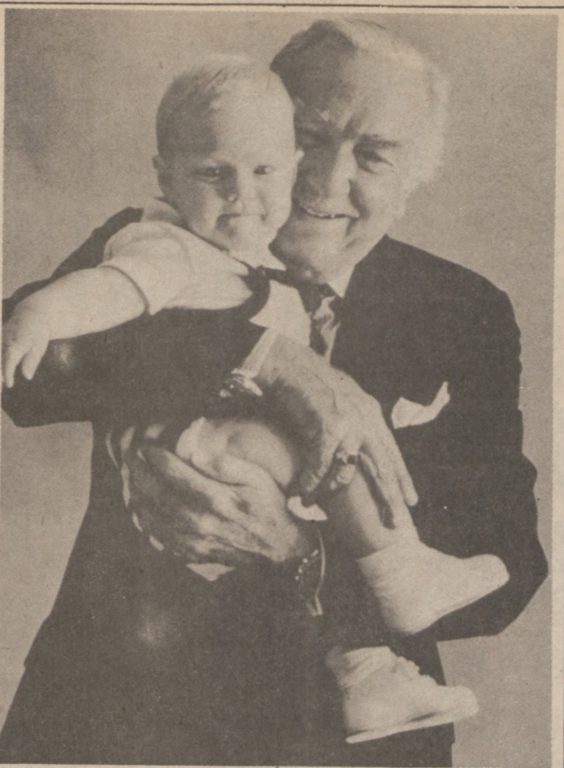
NOWY YORK. — Walter Cronkite z 8-miesięcznym wnukiem Buck.