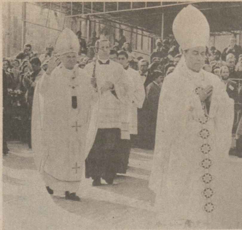
PALERMO, SYCYLIA. — Ojciec Święty w otoczeniu duchowieństwa i tłumów w czasie swej jednodniowej wizyty na Sycylii.

który stał się już tradycyjnym okresem wyjazdów.