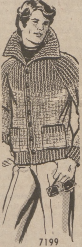
7199 by Alice Brooks

He'll appreciate this handsome jacket for his hand-knit luxury. Truly one of a kind just like him! Knit from the ribbed collar down all in one piece, including sleeves. Use synthetic worsted. Pattern 7199. Men's Sizes 38-44 included. $2.25 for each pattern. Add 50¢ each pattern for postage and handling. Send to: