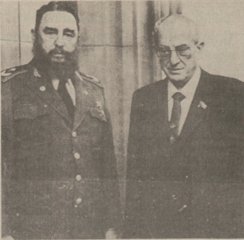
MOSKWA. — Fidel Castro i Juri Andropow w czasie spotkania, po pogrzebie Breżniewa, 16 listopada br.

Jeszcze przed otwarciem debaty w sprawie Afganistanu, 45 państw przedłożyło rezolucję wzywającą do usunięcia z jego granic wszystkich obcych wojsk i do pokojowego rozwiązania konfliktu.