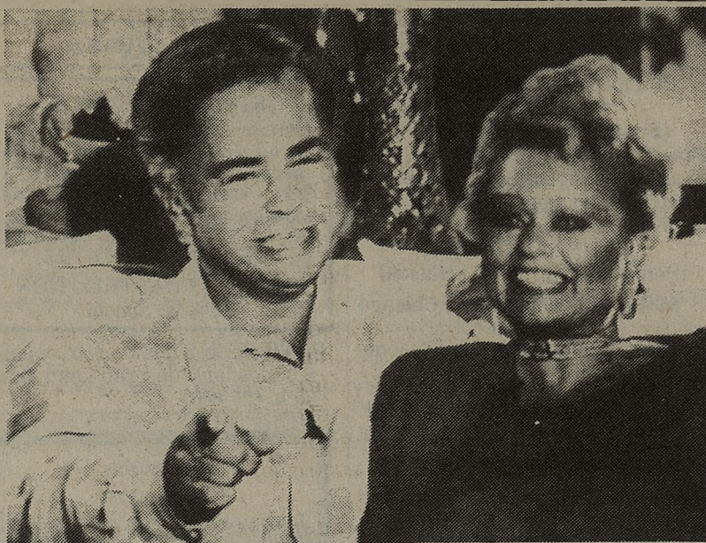
PALM SPRINGS — Były prezes PTL Jim Bakker udzielił wywiadu sieci telewizyjnej ABC, w którym domagał się powrotu na tron swego "religijnego imperium". Na zdjęciu, Jim Bakker z małżonką Tammy Fay w sym domu w Palm Springs w Kalifornii.

Wszyscy zainteresowani usprawnieniem komunikacji miejskiej (kolejki i autobusów CTA), mogą wcześniej zgłaszać tematy do dyskusji dzwoniąc na telefon 664-7200, wew. 3306.