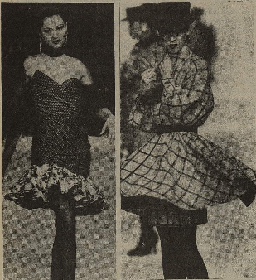
Z lewej, sukienka popołudniowa zaprojektowana przez Ungaro, z prawej, model Valentino. Mini sukienka i płaszcz z tego samego materiału.