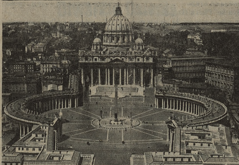
RZYM — Plac Św. Piotra

Kolejne spotkania będą dotyczyły sytuacji w Republice Płd. Afryki, Afganistanie, południowo-wschodniej Azji, szczególnie w Wietnamie i Kambodży.