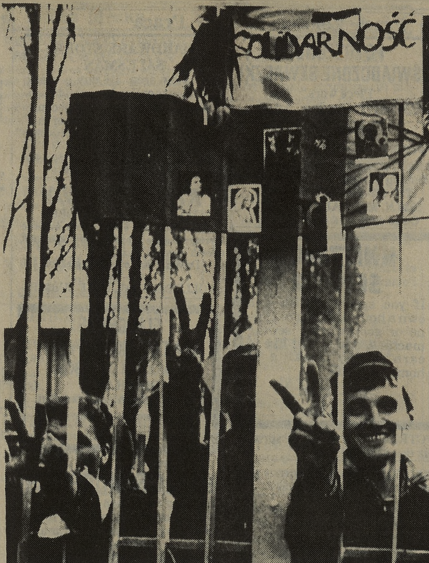
GDANSK — Wyciągnięte przez bramę stoczni gdańskiej ręce robotników mówią same za siebie. Na bramy umieszczono liczne transparenty z napisem "Solidarność" oraz wizerunki Matki Boskiej Częstochowskiej.

Jednocześnie Departament wyraził ubolewanie z powodu pogarszających się stosunków między USA a Singapurem krajem wnoszącym największy wkład w kierunku stabilności tego regionu świata.