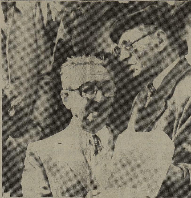
WARSZAWA — Podczas niezależnych manifestacji z okazji 45 rocznicy powstania w getcie warszawskim przemówienie wygłosił Marek Edelman, ostatni żyjący przywódca żydowskich powstańców.

Parę dni temu wybuch bomby uszkodził zabudowania jednego z barcelońskich banków. Nikt wtedy nie odniósł obrażeń.