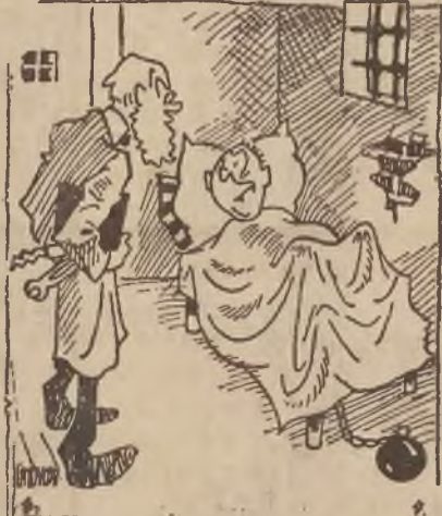
Lekarz: Nic panu poważnego nie jest. Ale wie pan co, dla ostrożności najlepiej będzie, gdy pan przez kilka pierwszych dni nie będzie wychodził z domu...