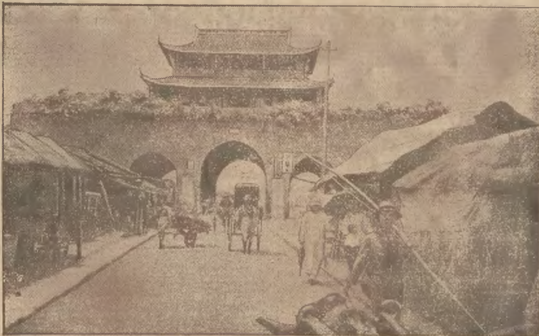
Jak już donieśliśmy, doszło ostatnio w Nankingu do poważnych zaburzeń studenckich. Na zdjęciu widzimy bramę w Nankingu, pochodzącą z XIV. wieku.