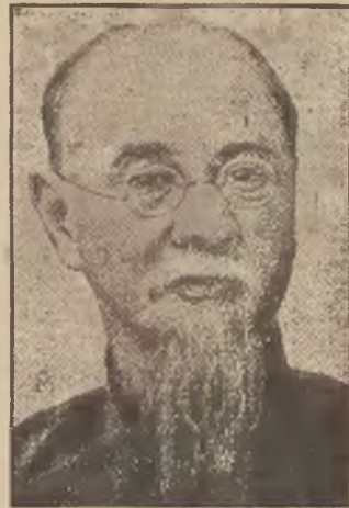
Prezydentem rządu chińskiego został wybrany Lin Sen