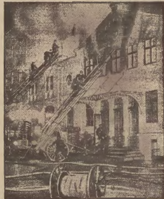
W Kopenhadze spłonął onegdaj teatr Nørrebro, jeden z najstarszych teatrów w Danii.