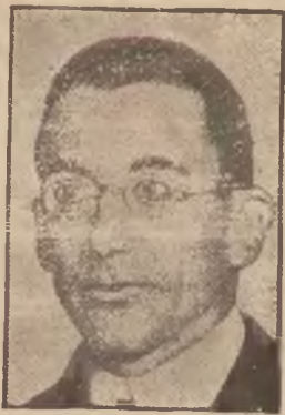
Luis de Zulueta nowy minister spraw zagranicznych w gabinecie Azany