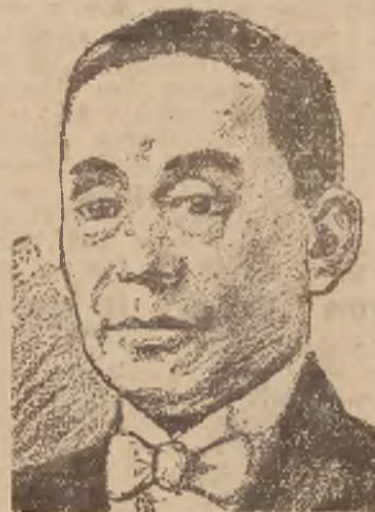
Kenkichi Yoshizawa, dotychczasowy ambasador japoński w Paryżu, został mianowany ministrem spraw zagranicznych Japonji.

wałych, tworzenia nowych, a specjalnie związków młodzieży.