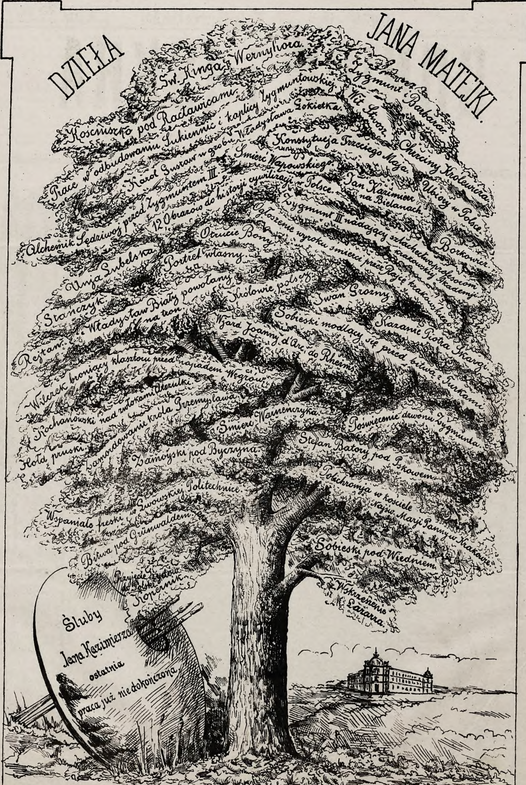
Bardzo wiele portretów uwiecznionych za arcydzieła malarskie. Mnóstwo szkiców historycznych, rysunków, archeologicznych kopii z pieczęci, naczyń, ubiorów, widoków starożytnych grobowców, ramków, budowli drewnianych i t.p. prac wielkiej artystycznej i historycznej wartości.