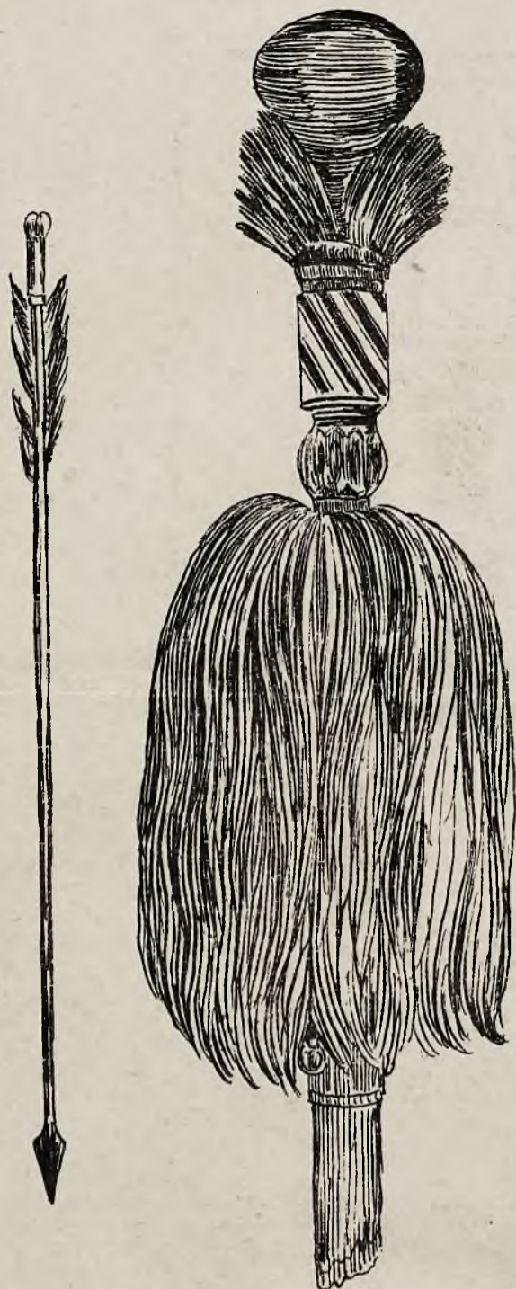
Strzala i buńczuk turecki zdobyty przez Jana III pod Wiedniem.