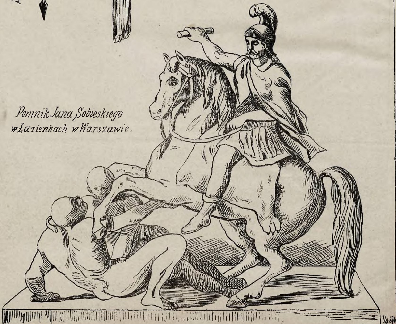
Pomnik Jana Sobieskiego w Łazienkach w Warszawie.