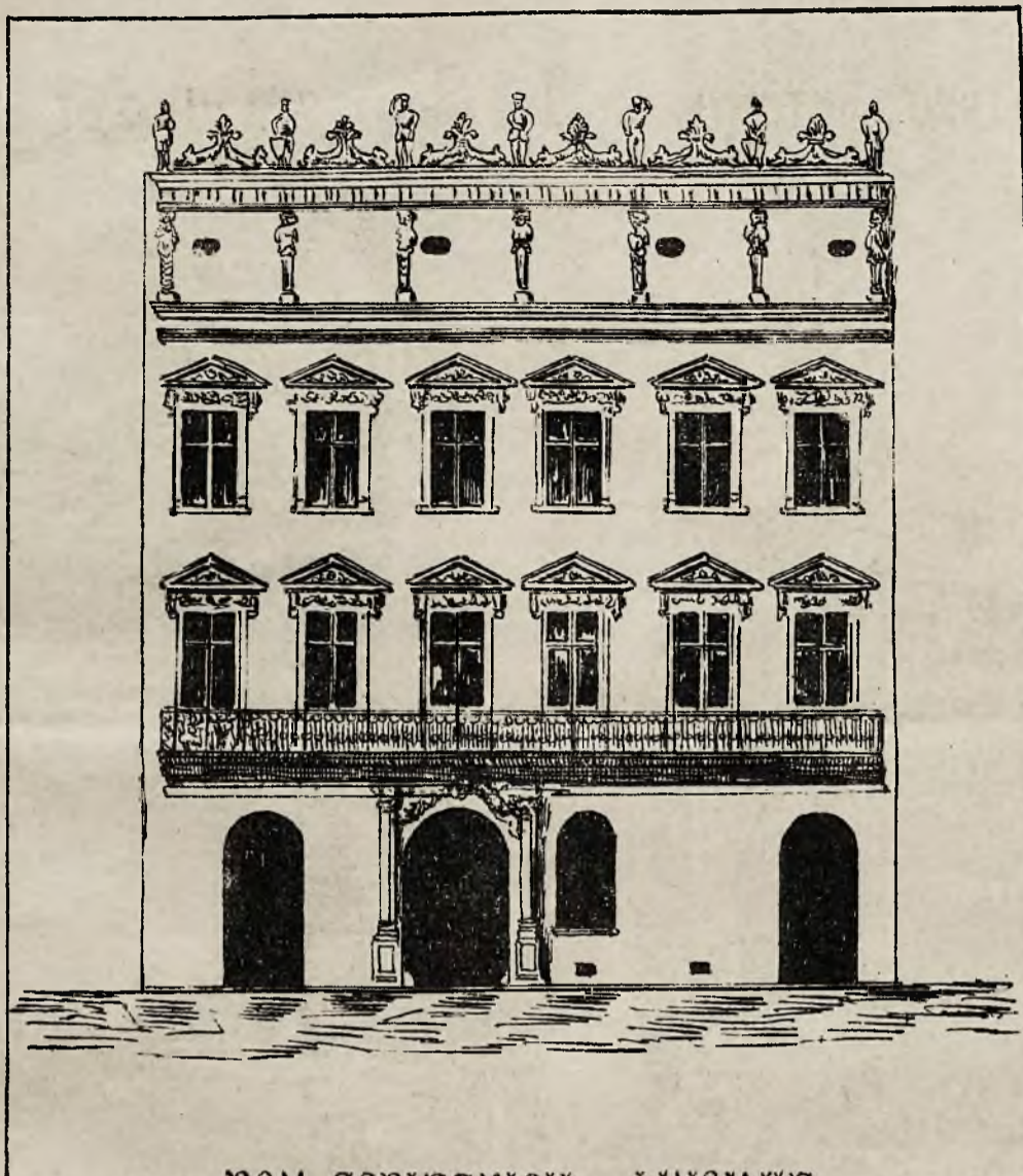
DOM SOBIESKICH WE LWOWIE.