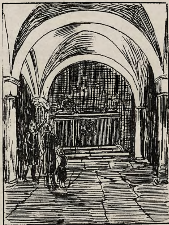
GROBOWIEC KRÓLA JANA III W KATEDRZE NA WAWELU.