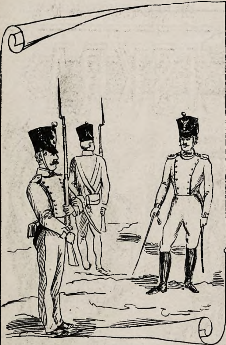
Putk 1 strzelców pieszych. Podoficer i oficer Grenadierów gwardji pieszej.