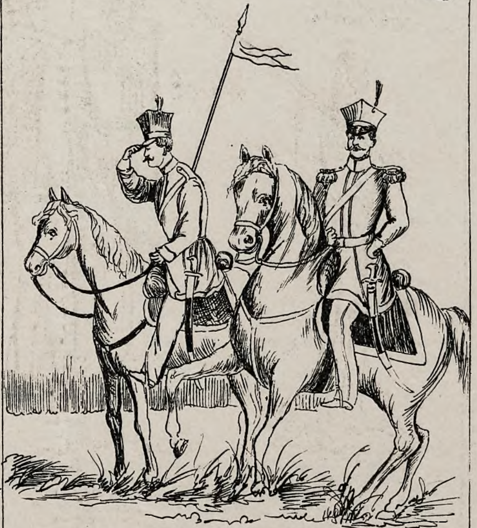
Pułk jardy Krakusów, im. Tadeusza Kościuszki.