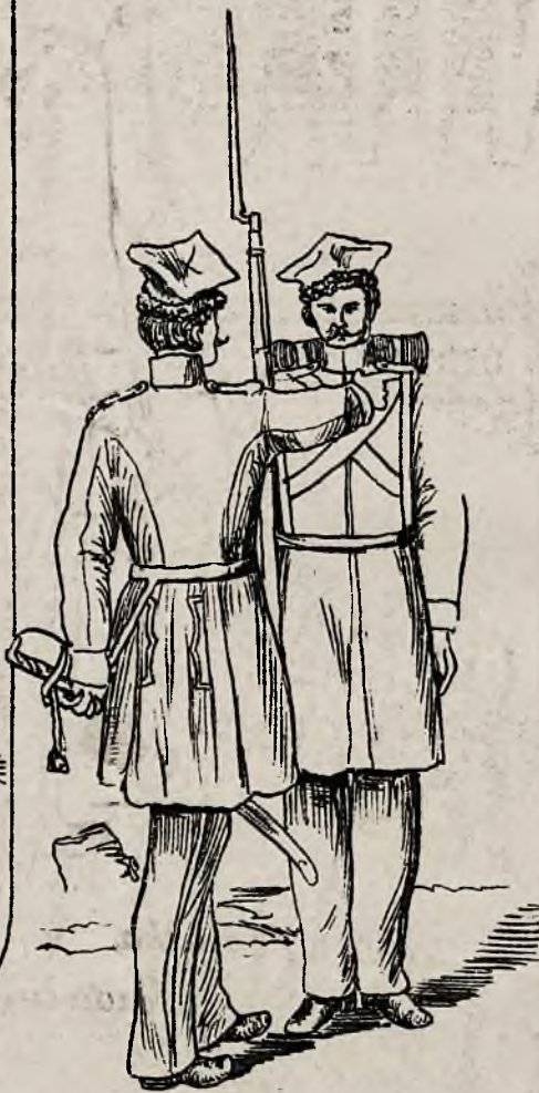
Putk 14 i 15, piechoty.