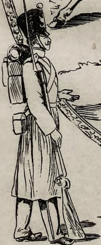
Pułk 4 piechoty. (Czwartaki.)