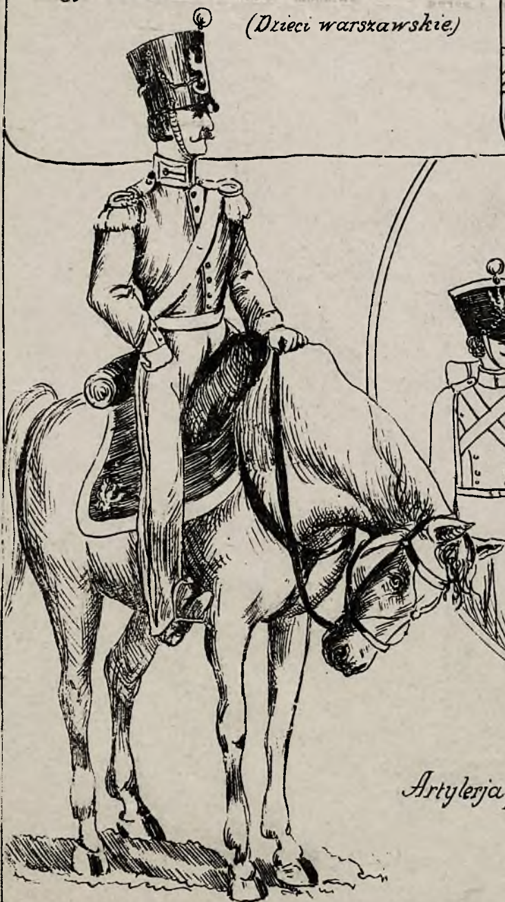
Pułk 5 Strzelców konnych, b.gwardji.