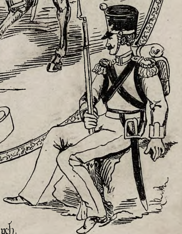
Pułk 5 Strzelców pieszych. (Dzieci warszawskie.)