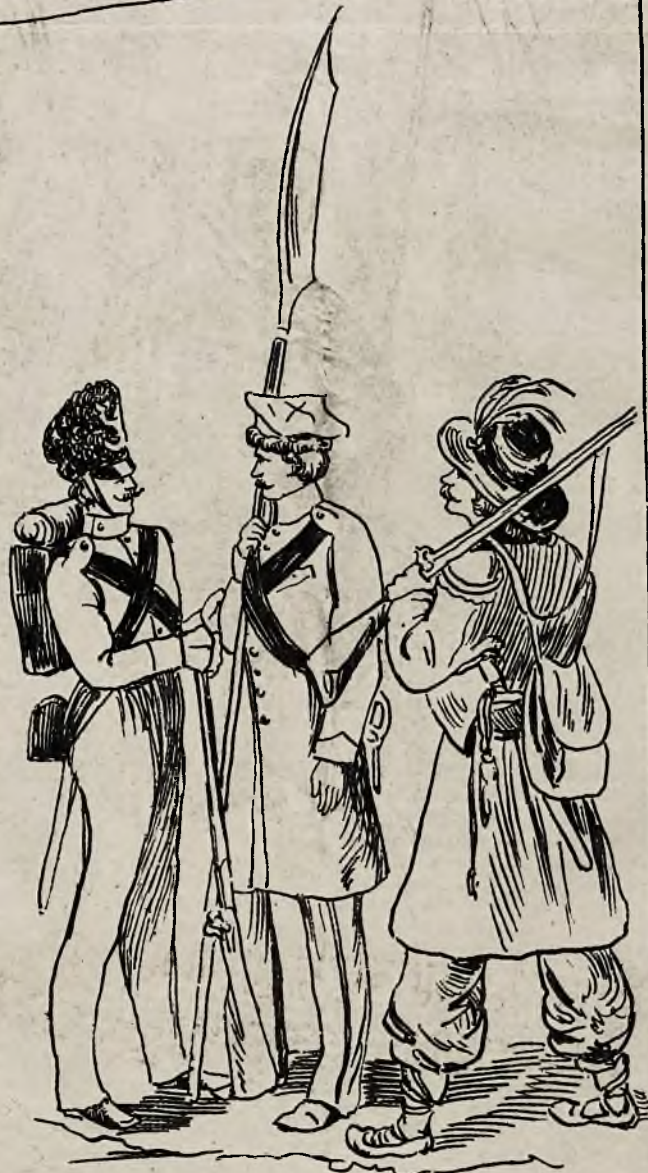
Strzelec kaliski, Putk 9 piechoty, Kurpik.