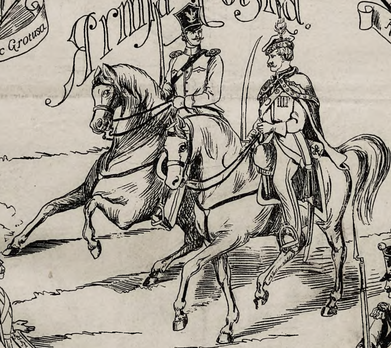
Wojnierze i oficerowie.