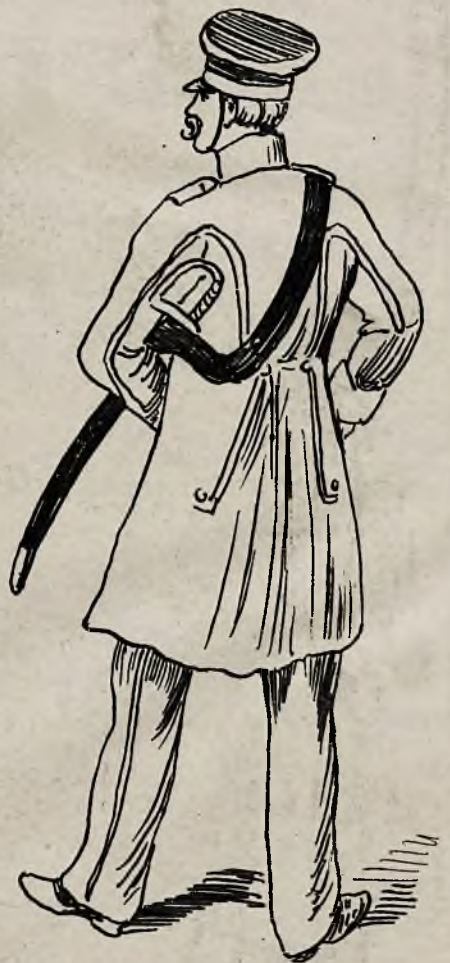
Putk 11 piechoty.