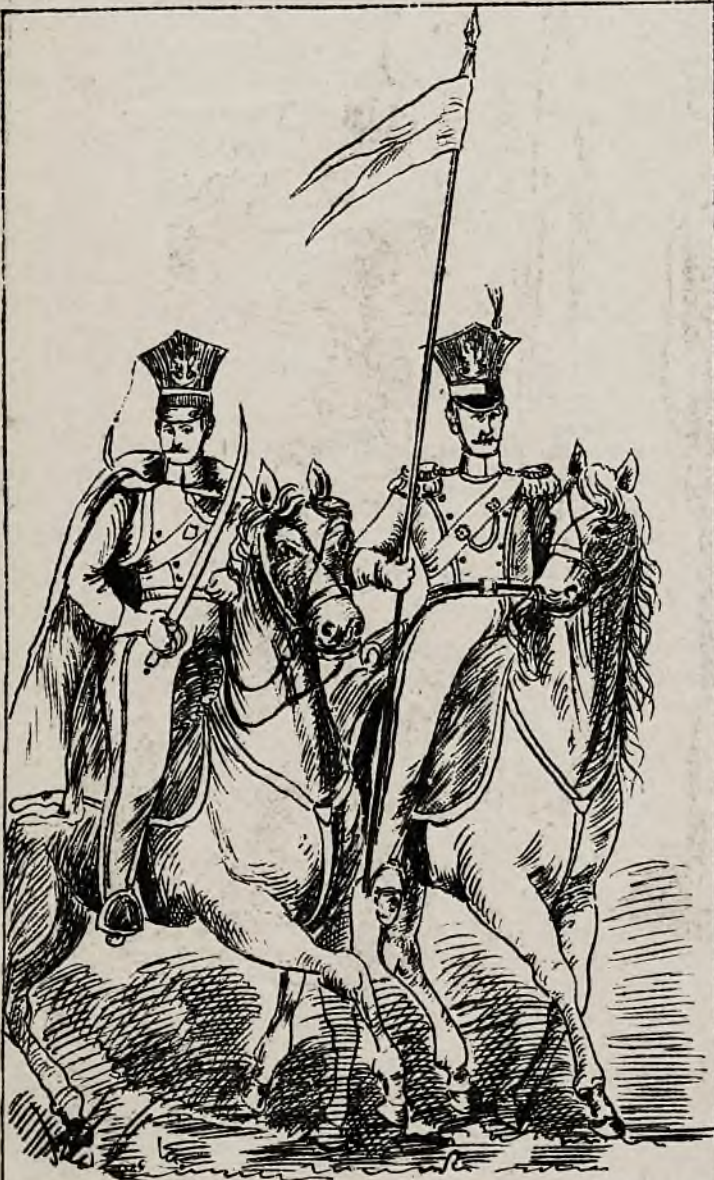
Legja nadwiślańska, i Pułk 6 Ułanów (Dzieci warszawskie)