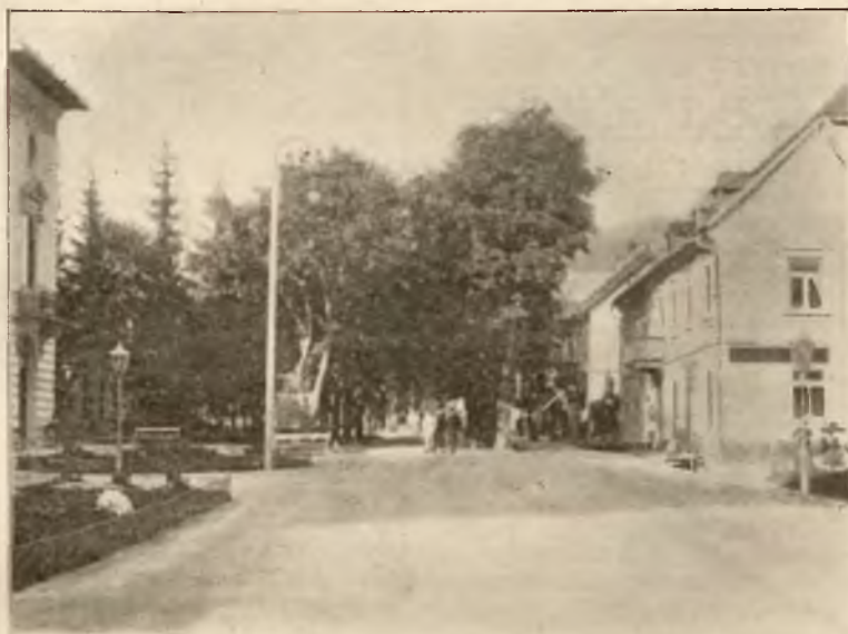
PLAC PRZED DOMEM ZDROJOWYM.

Osobne bezpośrednie wa- gony z Krakowa i Pod- woleczysk.