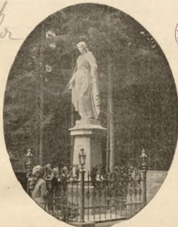
STATUA MATKI BOSKIEJ W PARKU.

Osobne bezpośrednie wa- gony z Krakowa i Pod- wożyczysk.