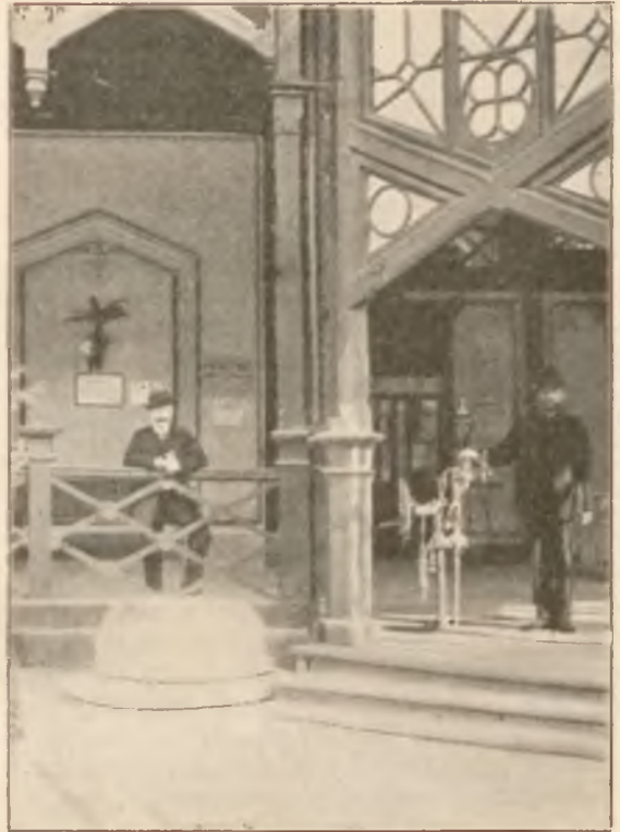
ZDRÓJ KAROLA W KRYTYM DEPTAKU.

Psy na deptaku uprasza się prowadzić na smyczy.