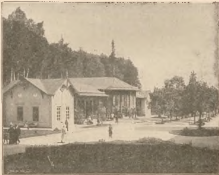
ZDRÓJ GŁÓWNY W KRYTYM DEPTAKU.

Osobne bezpośrednie wa- gony z Krakowa i Pod- wołoczysk.