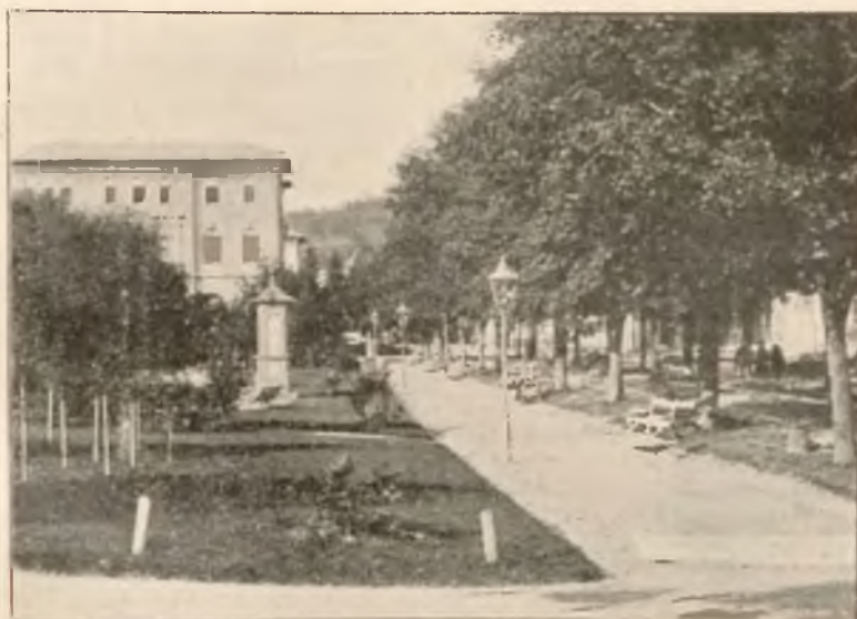
KIOSK METEOROLOGICZNY PRZY DEPTAKU.

Osobne bezpośrednie wa- gony z Krakowa i Pod- woleczysk.