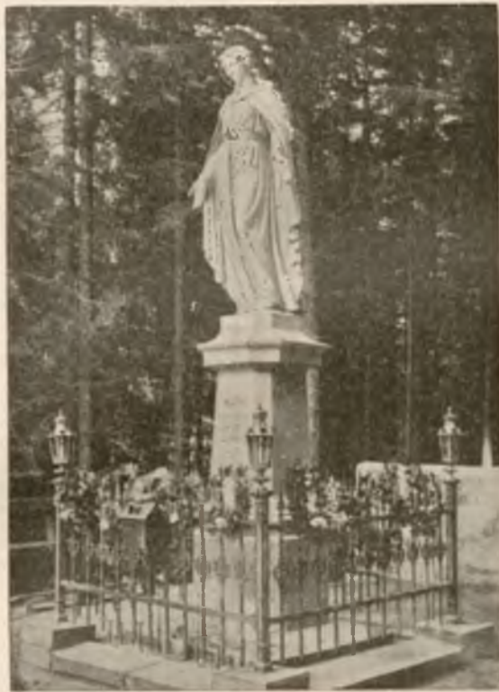
STATUA MATKI BOSKIEJ W PARKU.