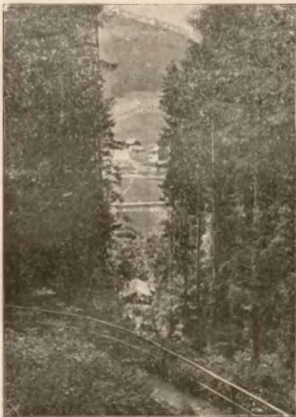
OKNO W PARKU.