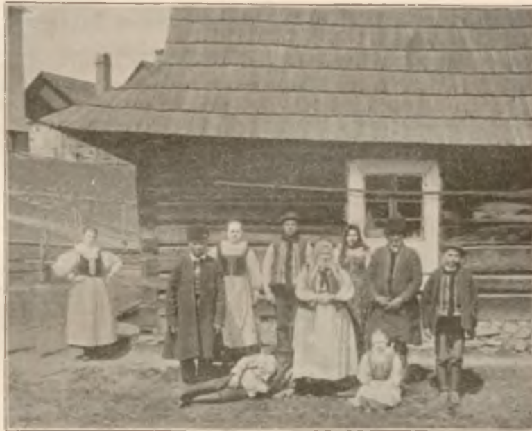
TYPY MIEJSCOWYCH WŁOŚCIAN.

Osobne bezpośrednie wa- gony z Krakowa i Pod- wołoczysk.