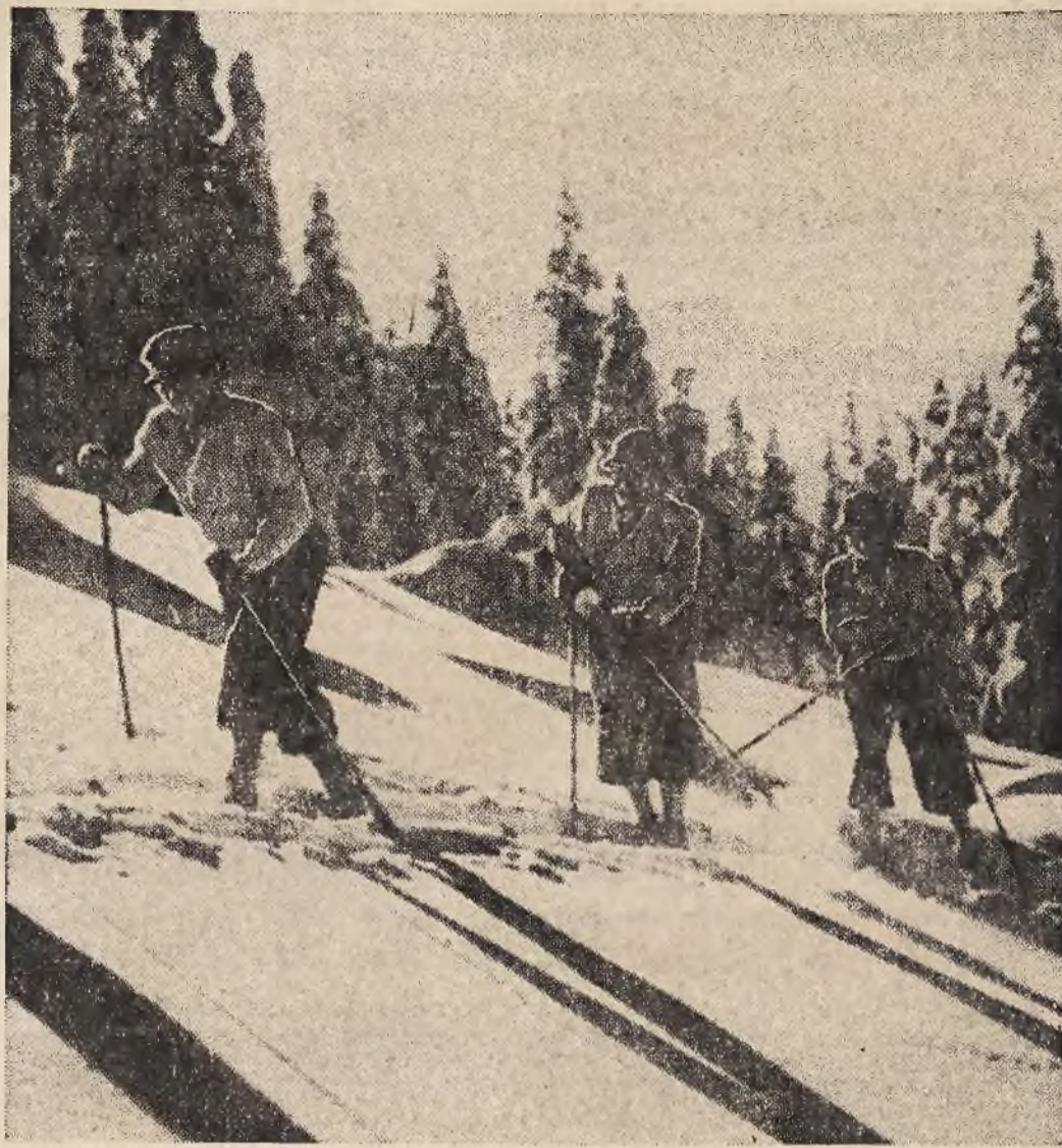
Na śnieżym śniegu.

Po oficjalnych wizytach noworocznych dr Tiso przyjął posła niemieckiego barona v. Killingera na audjencji pożegnalnej.