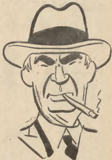
Nieoficjalny „ambasador“ Roosevelta na Europe...