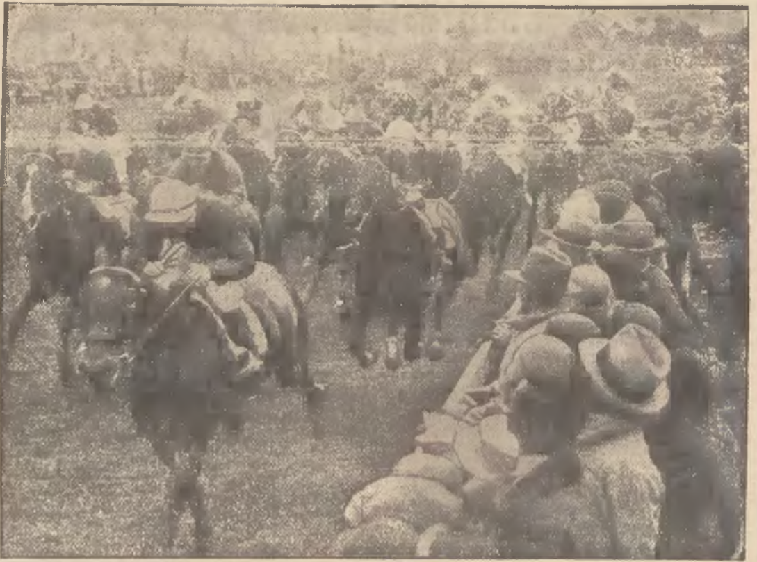
(—) Oto scena z wyścigów konnych z angielskiego Derby w Epson. Zwycięzca mimo spadku funta zdobył przecież nagrodę w wysokości przeszło 300.000 złotych. Zwyciężył koń Hyperjon, własność lorda Derby, potomka owego lorda Derby, którego nazwiskiem przed 150 laty ochrzczono wielkie wyścigi konne.

ra się pomóc chalucom — w ich hachszarce i co niezmiernie ważne — w aliji. A alija dziś szczególnie silnie się wzmożła. Fala chaluców wezbrała wprost. Stąd napór na Ezrę jako na instytucję, wspierającą chaluców wszystkich odcieni politycznych, stojących na gruncie odbudowy naszej siedziby narodowej.