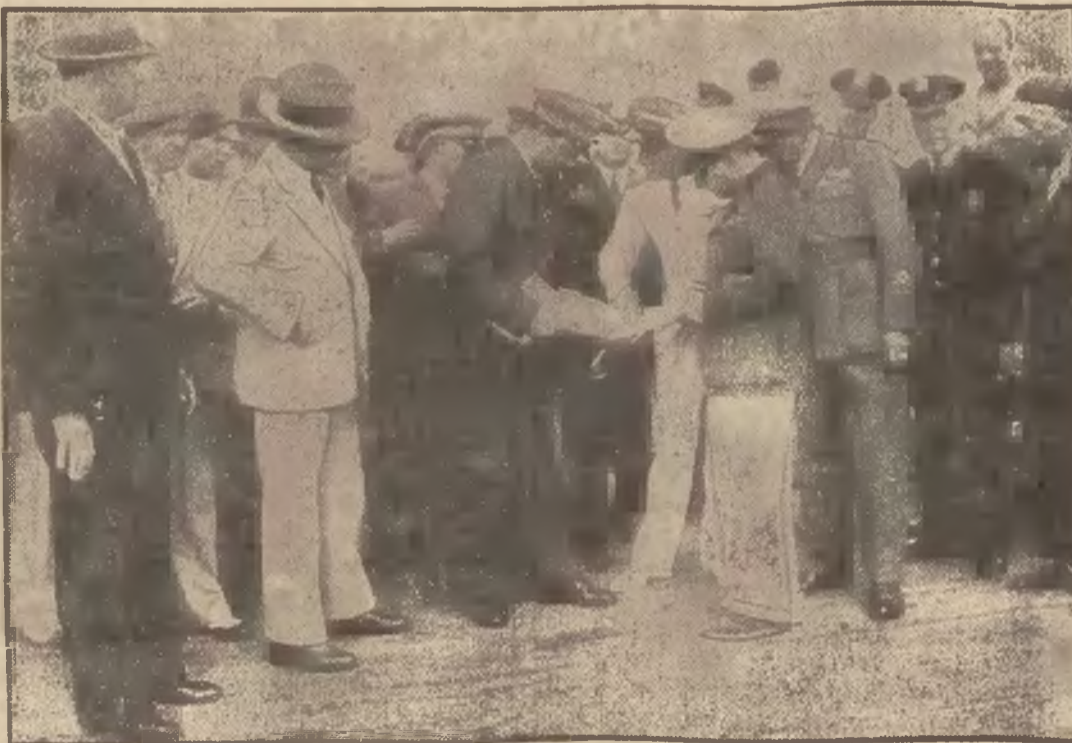
Gen. Balbo przebywa ze swą eskadrą na Nowej Funlandji, gdzie oczekuje korzystnych warunków atmosferycznych dla startu. Na zdjęciu widzimy go w towarzystwie swych oficerów, omawiającego biuletyny meteorologiczne.