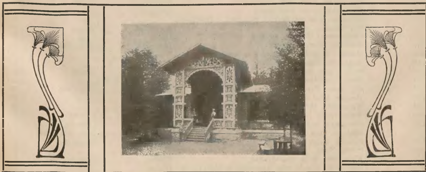
PAWILON MLECZARNI W SŁOTWINIE.