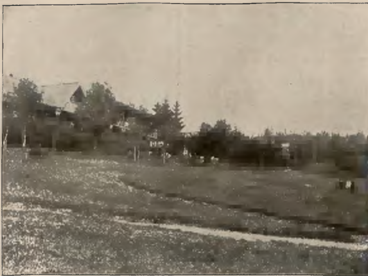
DOMY NA GÓRCIE.

W niedziele i święta rzym. kat. pociągi spacerowe.