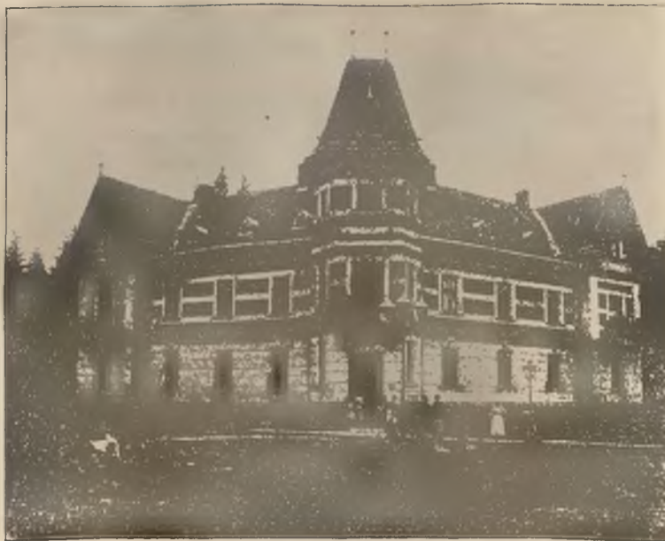
WILLA „POD BERŁEM“.

W niedziele i święta rzym. kat. pociągi spacerowe.