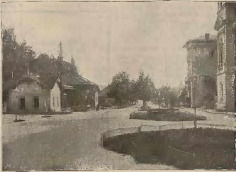
GLÓWNE ŹRÓDŁO W KRYTYM DEPTAKU.

W niedziele i święta rzym. kat. pociągi spacerowe.