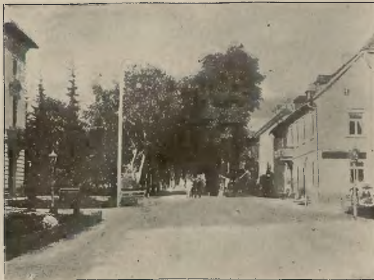
PLAC PRZED DOMEM ZDROJOWYM.

W niedziele i święta rzym. kat. pociągi spacerowe.