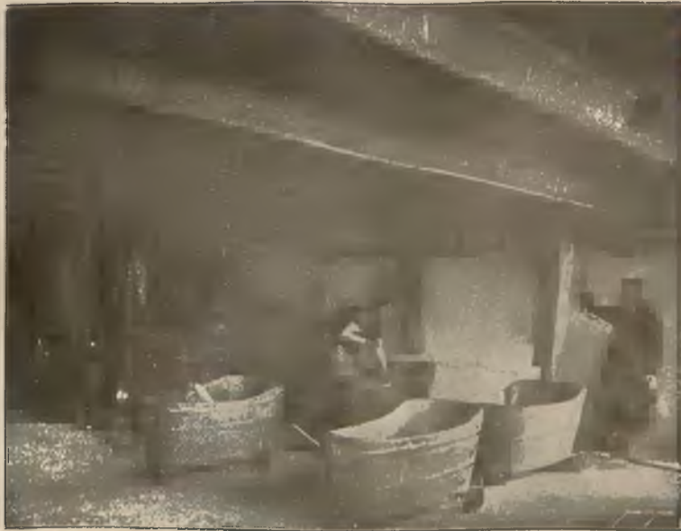
PRACOWNIA ŁAZIENEK BOROWINY.

W niedziele i święta rzym. kat. pociągi spacerowe.