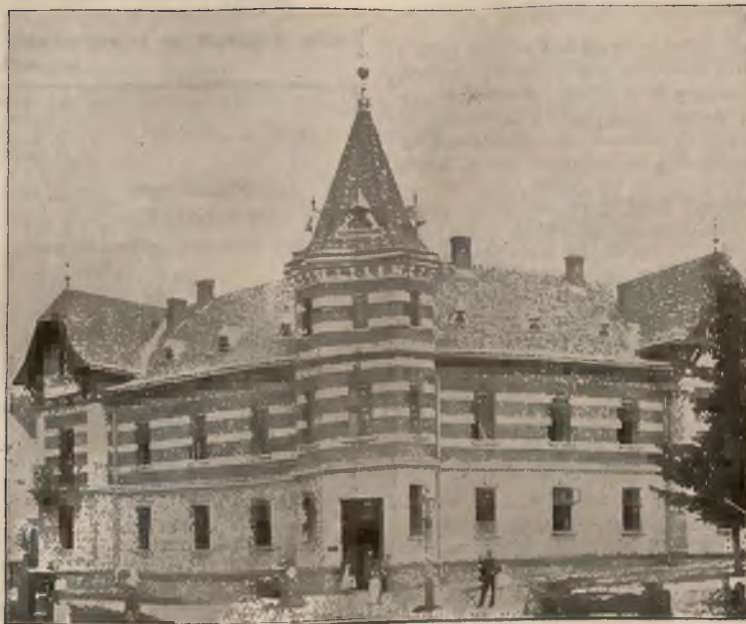
WILLA „POD KORONĄ“.

W niedziele i święta rzym. kat. pociągi spacerowe.