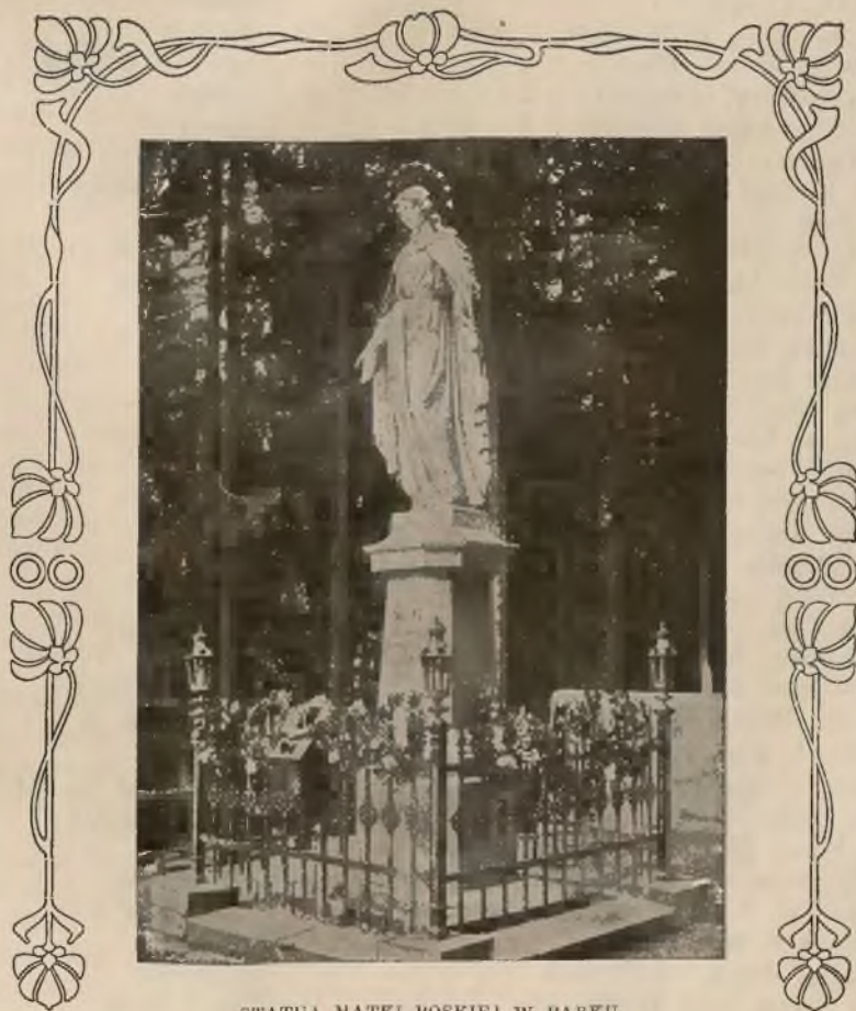
STATUA MATKI BOSKIEJ W PARKU.