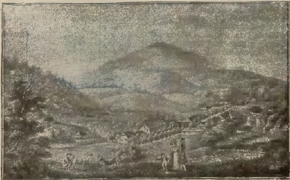
WIDOK KRYNICY W ROKU 1800.

Na poniedziałek dnia 8 b. m. zapowiedziany jest reunion w sali balowej domu zdrojowego.