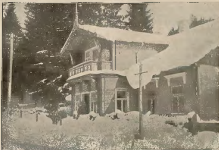
DOM „POD ZIELONĄ GÓRKĄ“.

W niedziele i święta rzym. kat. pociągi spacerowe.