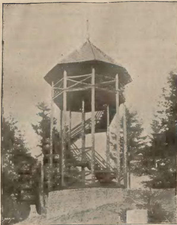
WIDOWNIA NA SZCZYCIE GÓRY „HUZARY“.

W niedziele i święta rzym. kat. pociągi spacerowe.