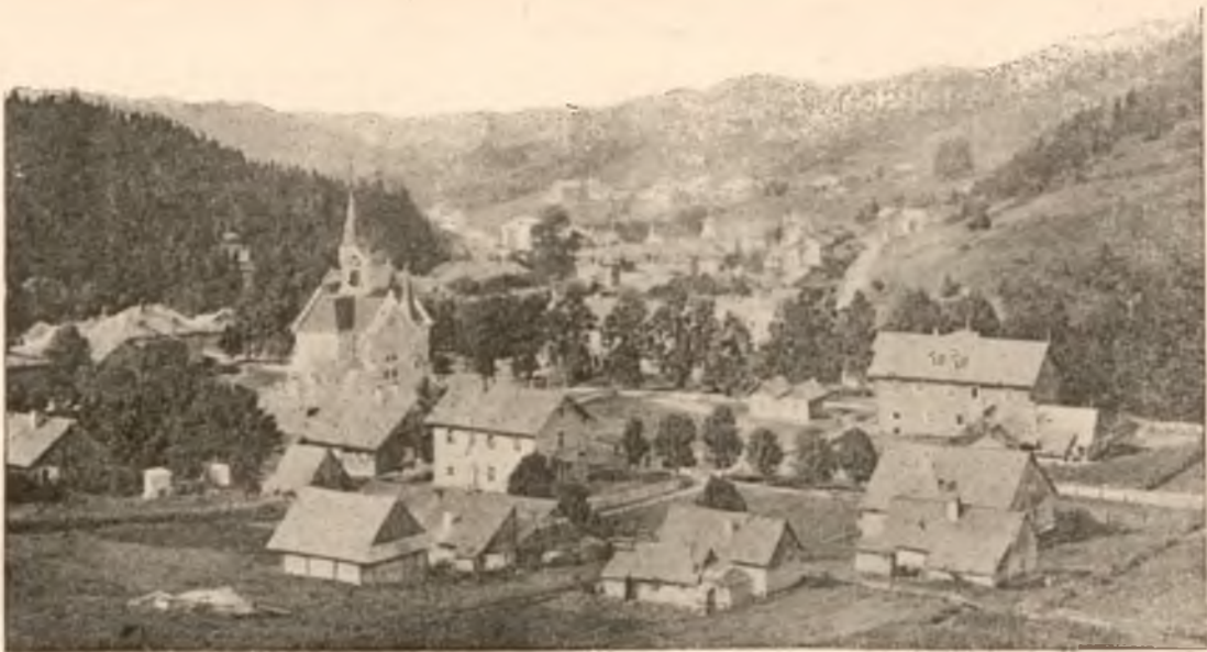
OGÓLNY WIDOK KRYNICY.