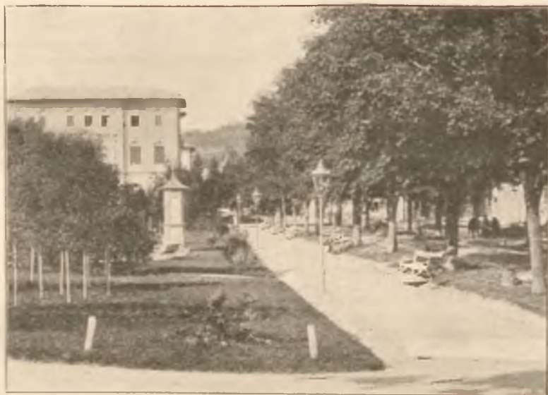
KIOSK METEOROLOGICZNY PRZY DEPTAKU.

Od 15-go czerwca osobne bezpośrednie wagony z Krakowa i Podwo- żeczysk.