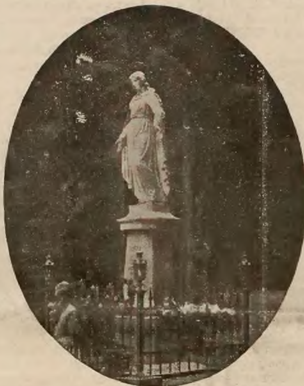
Posąg Matki Boskiej w parku.

Osobne bezpośrednie wagony z Krakowa i Podwołoczysk.