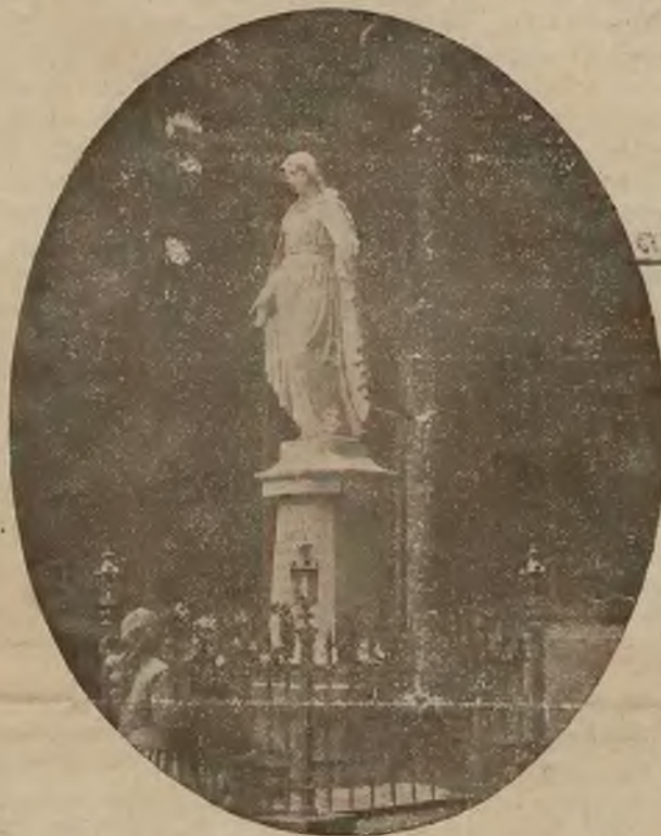
Posąg Matki Boskiej w parku.

Osobne bezpośrednie wagony z Krakowa i Podwoleczysk.