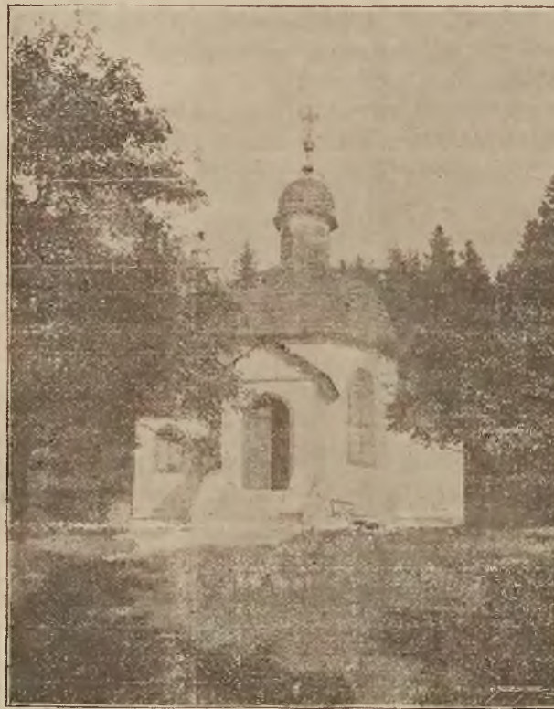
Kaplica w parku w Krynicy.

Osobne bezpośrednie wagony z Krakowa i Podwołoczysk.