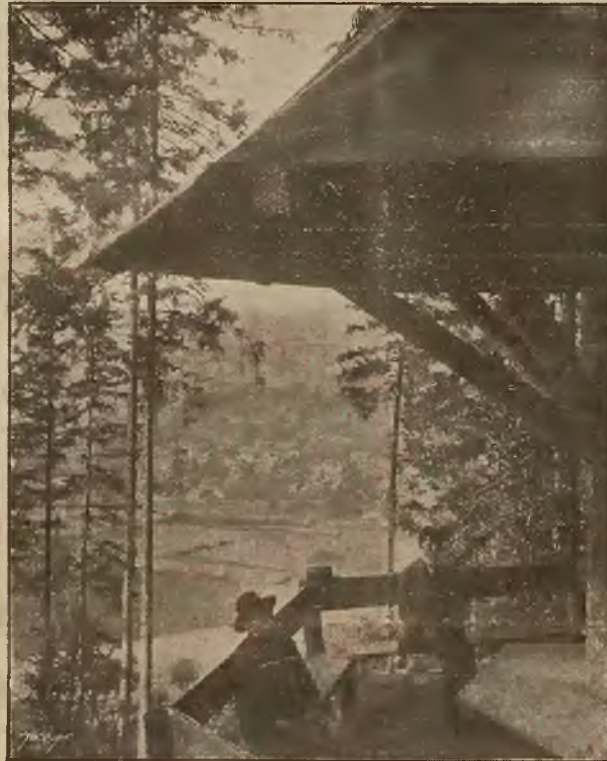
Park w Krynicy. — Widsk z Parasola.

Osobne bezpośrednie wagony z Krakowa i Podwoleczysk.