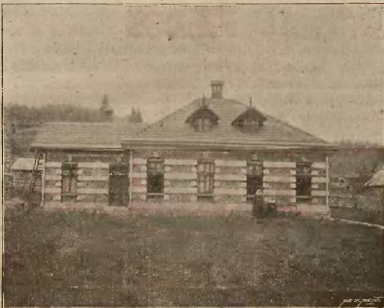
Dom izolacyjny w Krynicy.

Osobne bezpośrednie wagony z Krakowa i Podwołoczysk.