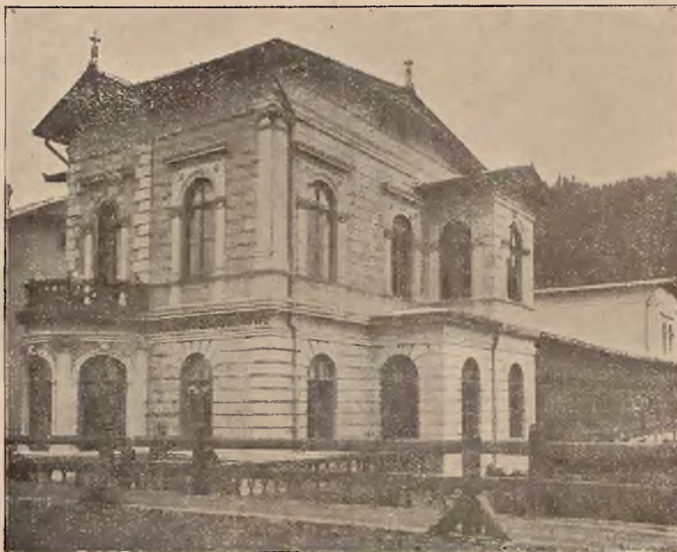
ŁAZIENKI BOROWINOWE W KRYNICY.

Osobne bezpośrednie wa- gony z Krakowa i Pod- woleczysk.