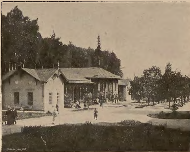
ZDRÓJ GŁÓWNY W KRYTYM DEPTAKU.

Osobne bezpośrednie wa- gony z Krakowa i Pod- woleczysk.