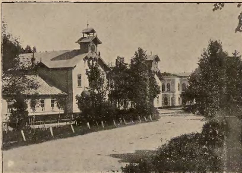
ŁAZIENKI MINERALNE I BOROWINOWE.

Osobne bezpośrednie wa- gony z Krakowa i Pod- wołoczysk.