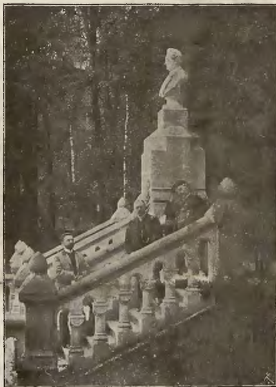
POMNIK Dra DIETLA.