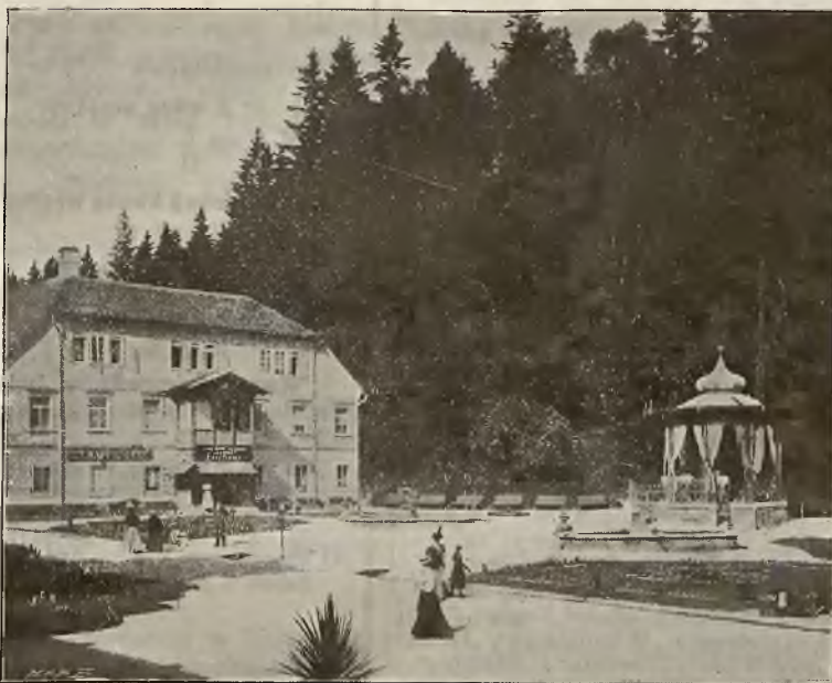
DOM „POD ORŁEM” i PAWILON DLA MUZYKI.

Osobne bezpośrednie wa- gony z Krakowa i Pod- woleczysk.