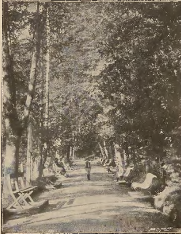
ALEJA W PARKU.