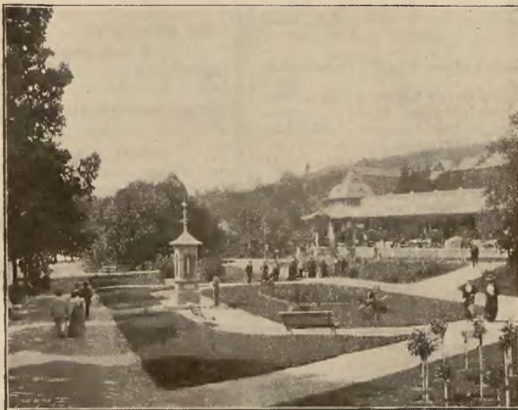
KIOSK METEOROLOGICZNY I BAZAR.

Osobne bezpośrednie wa- gony z Krakowa i Pod- woleczysk.