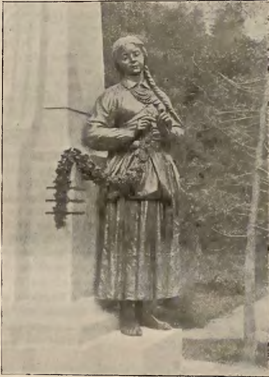
Figura bronzowa z pomnika A. Mickiewicza.