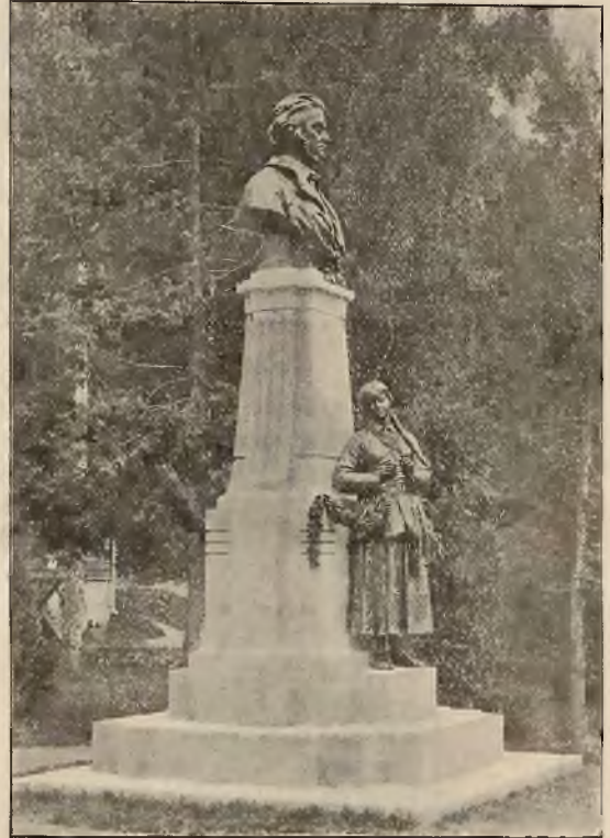
Pomnik A. Mickiewicza.

Gdzie ci mężowie, co błyskiem swej stali, Gromem orężów — jak głazmi Tytani Całe narody do swych stóp rzucali...? Zmarnieli — ludów przekleństwem ścigani... Lecz ten, co wszechświat chciał objąć w ramiona, I w tym miłości olbrzymim popędzie Światy i ludy przytulił do łona, Ten żył i żyje i wiecznie żyć będzie!