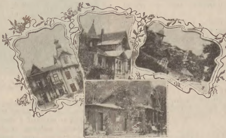
Widoki z Truskawca.

zwrócić uwagi na wybrzeża Morza Czarnego (Odessa, Krym), ze względu na geograficzne położenie dla południowych okolic naszego kraju, oraz licznie tam zamieszkałych Polaków. W sezonie zimowym, jesiennym i wiosennym stacye morskie niemieckie nie wchodzi w rachubę, idzie tylko o sezon letni. W tym względzie stacyom morskim niemieckim należy przeciwstawiać wybrzeża bejgijskie, holenderskie i duńskie, na których obok renomowanych i drogich stacyi pierwszorzędnych