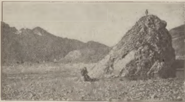
Szczawnica: Kotunka w Pieninach.

Zdrojowisko to znajduje się — jak wiadomo — w obwodzie sądeckim, w pięknej dolinie Beskidu, 483 metrów nad poziomem morza, otoczone wysoko wznoszącymi się ponad wsią górami. Źródła jej wytryskują z piaskowca karpackiego, w wielu miejscach trachitem przebitego — a jest ich 7, prawie ze sobą zgodnych tak co do składu, jak i co do ilości składników: zdroj Józefiny, Stefana, Magdaleny, Waleryi, Szymona, Anieli i Wandy. Wody szczawnickie są to szczawy alkaliczne, sodowe i litowo-sodowe, żelazo, jod i brom zawierające, zastąpić więc mogą w zupełności Obersalzbrunn,