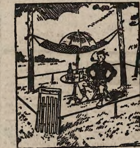
Domek wypoczynkowy, szkota. Same oszczędności.