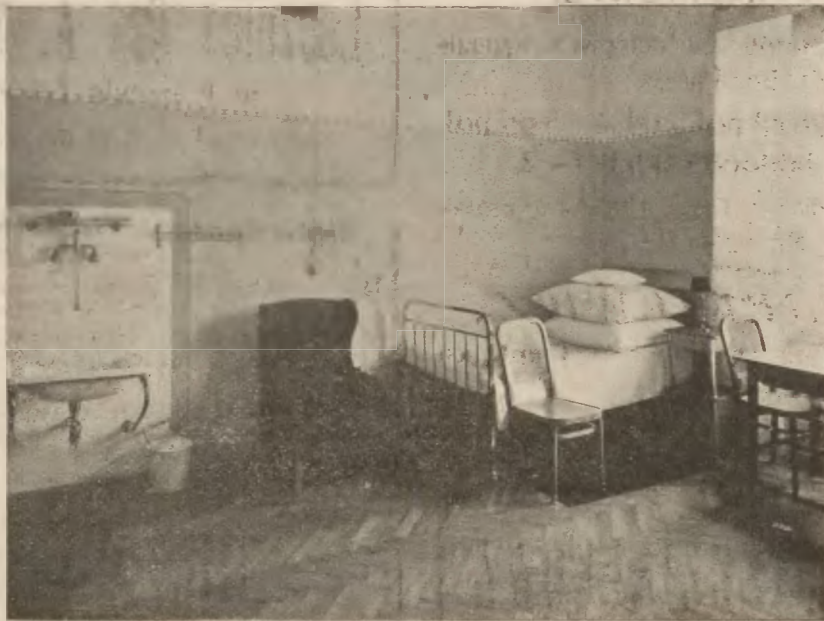
Lecznica Związkowa: Pokój chorych.

Druga lista gości Krynickich wykazuje osób 560. Ogłoszenie subskrypcyj. Zwracamy uwagę P. T. Kolegów i Czytelników naszego pisma na ogłoszenie subskrypcyj na Zakład wodolecznicy Dra A. Chramca w Zakopanem.