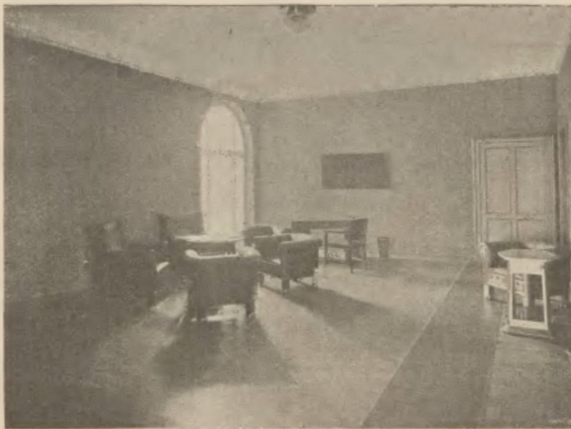
Lecznica Związkowa: Hall I. piętra.