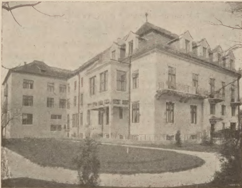
Lecznica Związkowa: Widok ogólny.

O godz. 6-tej po południu w pięknej, wielkiej sali Krakowskiego Towarzystwa lekarskiego odbędzie się gło-