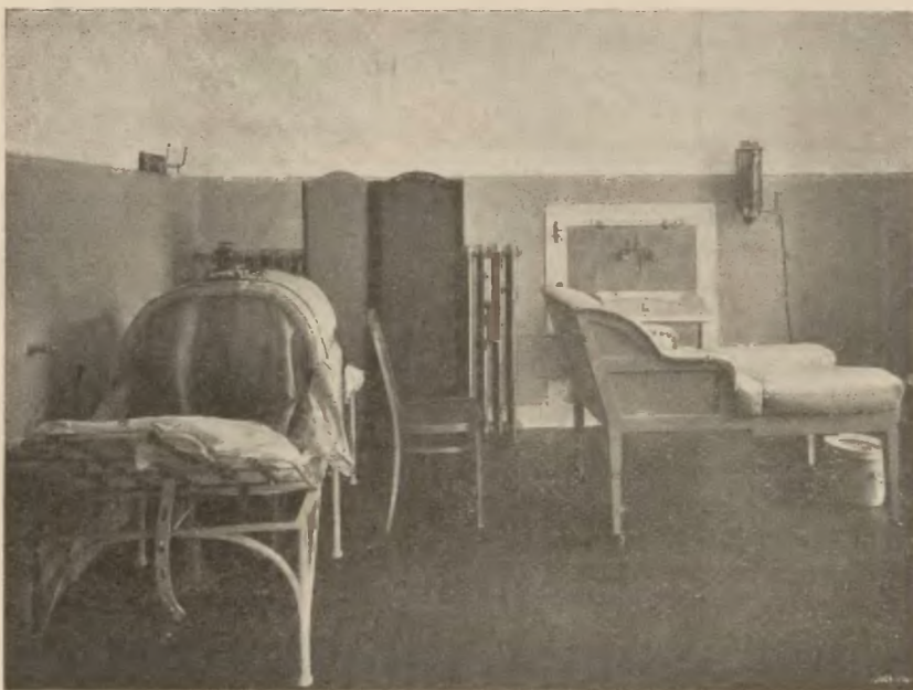
Lecznica Związkowa: Zakład ginekologiczny.

Niemal w letargu pozostaje organizm wielu przez 11 miesięcy w roku. Miesiąc 12 poświęca się willegiaturze, lecz i w tym miesiącu, tryb życia wielu bywa dalszym ciągiem zasypiania funkcji żywotnych, albowiem w bezwzględnym spoczynku szukają pokrzepienia kuracyusze, zwłaszcza polscy, nieświadomi postępowania, pogłębiającego coraz bardziej letarg przemiany materii. Wręcz odmienne są pojęcia w zakresie pielęgnowania zdrowia u innych narodów. Przypatrzmy się fizyognomii Berlina lub Wiednia w niedziele i święta. Już wczesnym rankiem roi się od tłumów turystów, spieszących za miasto, gdzie wśród ćwiczeń gimnastycznych i różnorodnych sportów spędzają dzień cały w blasku słońca, owiani ożywczym powietrzem. W godzinach południowych odczuwa się wyludnienie wzmiankowanych miast, bo z wyjątkiem ziewających przeciągle dorożkarzy i tu i ówdzie snujących się leniwie grup przejezdnych (przysiągłbym, że to są chwilowo bawiący... Polacy), nie napotkasz mieszkańca z tych grodów. A u nas? Wycieczki stały się wprawdzie modne, lecz przemianę materii pobudzają przy tej sposobności... konie, powozy i samochody, a w zakładach kąpielowych wybiera się często ku-