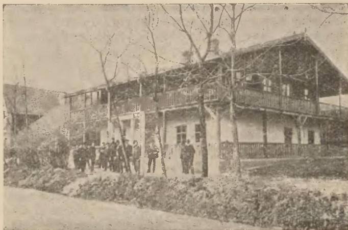
Swoszowice: Willa Nałęczówka.

Mieszkania jużto są zaopatrzone w piece, jużto centralnie ogrzewane. Niektóre pozostają w związku z kuchniami. Pokoje gościnne umeblowane czysto, mają wygo-