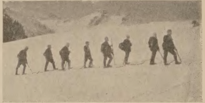
Narciarze w Zakopanem.

Masażyści i kąpielowi oraz masażyści i kąpielowe, uprawnieni do wykonywania pomocniczych zabiegów leczniczych według cennika; za nacieranie codziennie rano (wodą, lub przepisany płynem) za tydzień 5 kor., za miesiąc 20 kor., za jednorazowe założenie opaski 75 h., za masaż częściowy 2 kor., za masaż ogólny 4 kor., za dyżur nocny przy chorym 6 kor., za dyżur dzienny