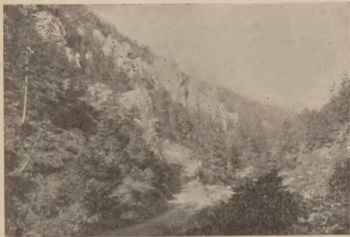
Morskie Oko w Zakopanem.

Część obszaru gminnego nazywa się stacją klimatyczną, której wyrazem są komisya klimatyczna i lekarz stacji klimatycznej. W ręku komisji spoczywają złe i dobre losy Stacji i dozór nad wykonywaniem policyi przez gminę. Pobiera ta komisya opłaty od gości, a za pieniądze te oświetla ulice, skrapia je latem, buduje chodniki, utrzymuje w letnich miesiącach muzykę, a przedewszystkiem spłaca ogromne długi i zobowiązania dawniej porobione. Z tego wynika, że mając tak wiele i na tak dużej przestrzeni do zrobienia, a nie mając w rzeczywistości władzy, nie spełnia ona swego zadania tak, jakby tego w interesie uzdrowiskazyczyć sobie należało. Następstwem naturalnem tej dwu