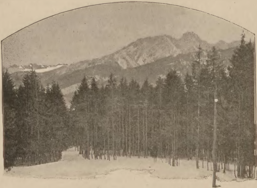
Zakopane: Widok na góry z Sanatorium Dra Dłuskiego.

drugim nie przeszkadzają, mieszcząc się wygodnie zdala od siebie i obok siebie na ogromnej przestrzeni, blisko 40 klm. 2 . Poza to wyrobił się pewien podział naturalny na sezon letni i sezon zimowy, a właściwie jest Zakopane przez rok cały doskonałą stycą klimatyczną i turystyczną. Rzeczą poważnej i gruntownej pracy jest udowodnić tu twierdzenie, uznane już zresztą częściowo i teoretycznie i praktycznie, i rozgłosić je szeroko, by przekonać przedewszystkiem tych lekarzy, którzy Zakopanego nie znając, lub znając je zaledwie z kilkudniowego tutaj pobytu, decydują tak często o szkodliwości naszego klimatu w pewnych miesiącach, i to mylne przekonanie wpajają w swoich pacjentów. Zanadto wogóle ufa Zakopane swym przyrodzonym siłom i za mało rozgłasza swoje zalety, a próby reklamy rzetelnej przedsięwzięliśmy dopiero w ostatnich czasach. Na to, jak i na wiele innych spraw niezbędnych