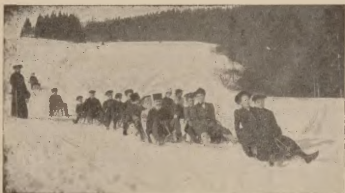
Sport saneczkowy w Zakopanem.