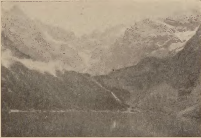
Zakopane: „Dolina Strązyska“.

6-letnie doświadczenie pozwala nam śmiało twierdzić, że rezultaty powyższej metody leczniczej są w naszym Zakładzie, dorównywanym swymi urządzeniami najlepszym sanatoriom zagranicznym, nadspodziewanie pomyslnie, o ile kuracja rozpoczęta jest dość wcześnie i trwa dostatecznie długo.