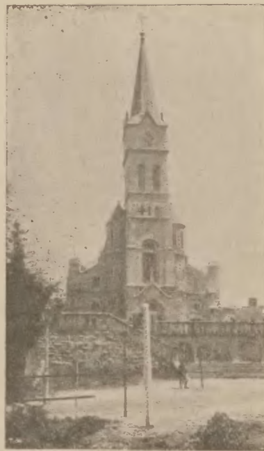
Kościół w Zakopanem.

Nasza metoda lecznicza, panująca dziś wszechwładnie po sanatoryjach zagranicznych, a stworzona przez Brehmera, jest klimatyczno-hygieniczno-dyetyczna. Każdy pacjent znajduje się stale pod troskliwym dozorem lekarskim, przez co unika szkodliwych wpływów i łatwiej może wyzyskać środki lecznicze, którymi Zakład rozporządza. Z tych najważniejszych jest stale używanie powietrza górskiego w czasie przechadzek po ścieżkach parku lub spoczywania na wygodnym leżaku. Metoda ta jest stosowana ze ścisłym uwzględnieniem indywidualnego stanu pacjentów. W ten sposób od rana do wieczora chory może oddychać zbawiennym górskim i leśnym powietrzem.